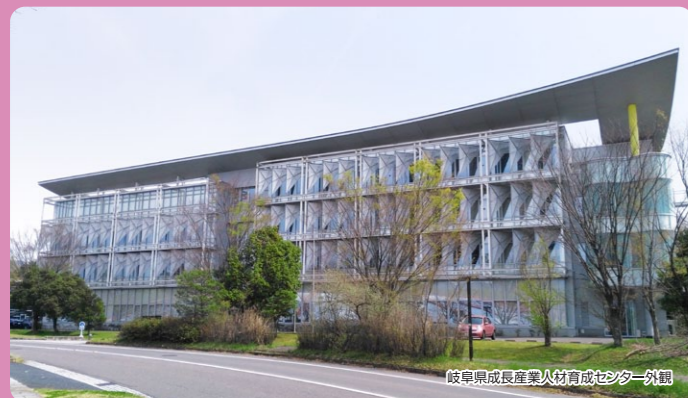
岐阜県成長産業人材育成センター外観

〒509-0109 各務原市テクノプラザ1-21 アネックス・テクノ2 岐阜県成長産業人材育成センター 202号室